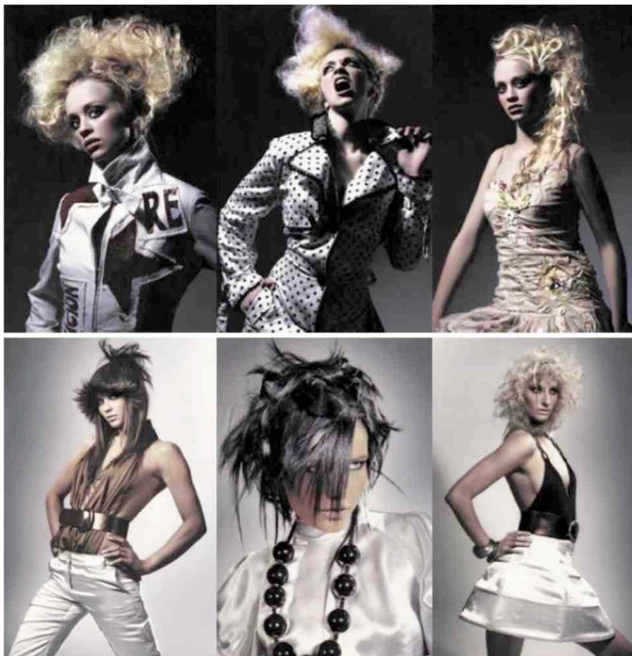
Håret gør det sidste